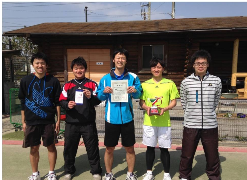
優勝 JX日鉱日石エネルギー（横浜市）