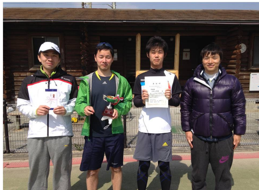
準優勝 キヤノン矢向（川崎市）