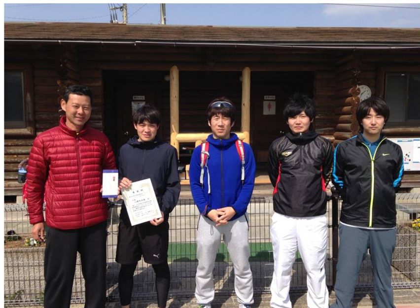
三位 大磯町役場（平塚市）