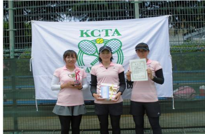
女子準優勝 相模原市教職員 (相模原市)