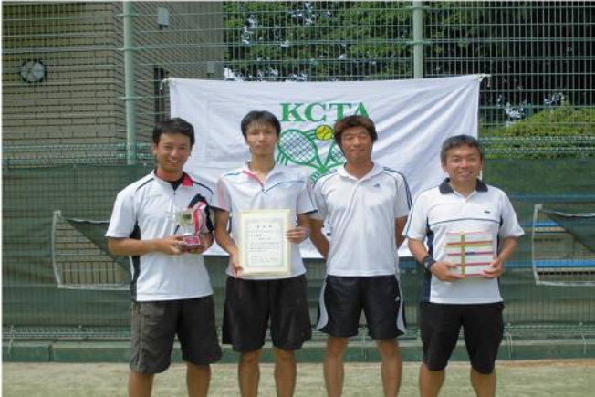
男子優勝 図 研 (横浜市)