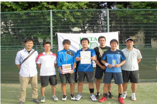
男子三位 東洋製罐 (横浜市)