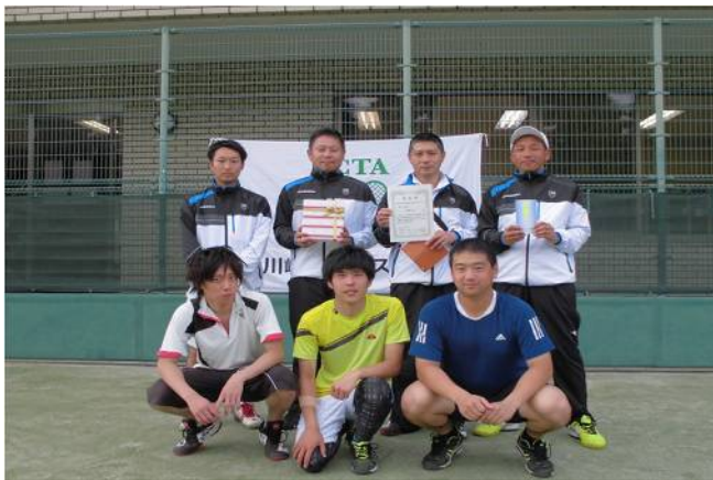
男子三位 MDIS (鎌倉市)