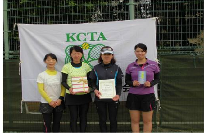
女子三位 藤沢市役所 (藤沢市)