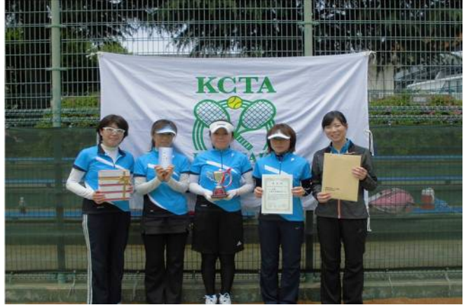
女子優勝 三菱化学横総研(A) (横浜市)