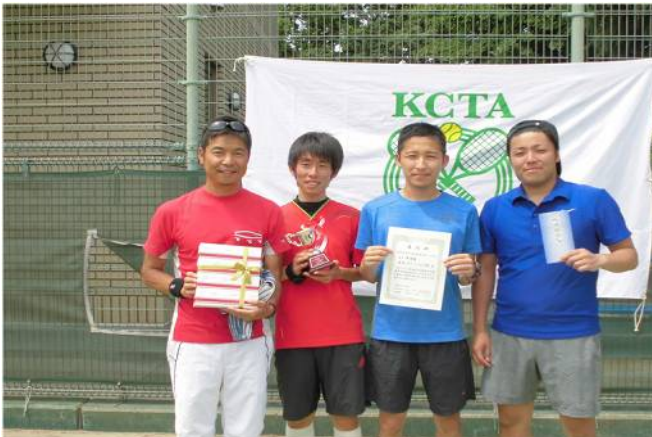
男子準優勝 日立ソリューションズ(B) (横浜市)