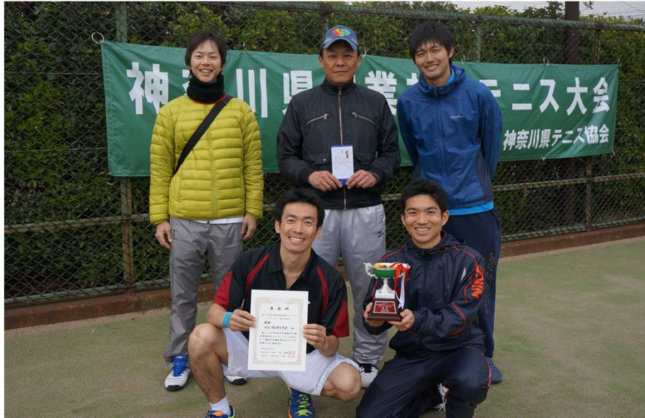
優勝 AGC旭硝子中研B (横浜市)