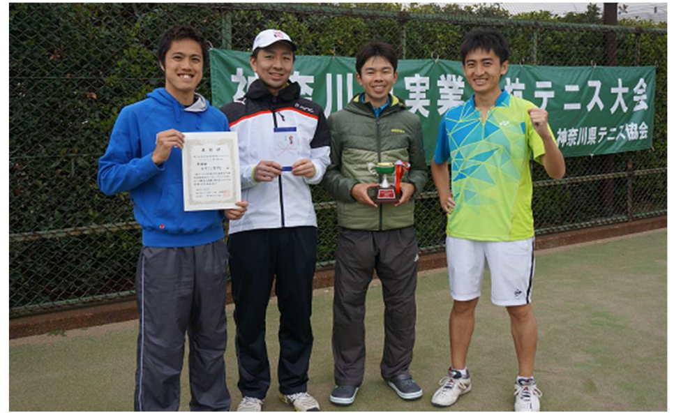
準優勝 キヤノン矢向 (川崎市)