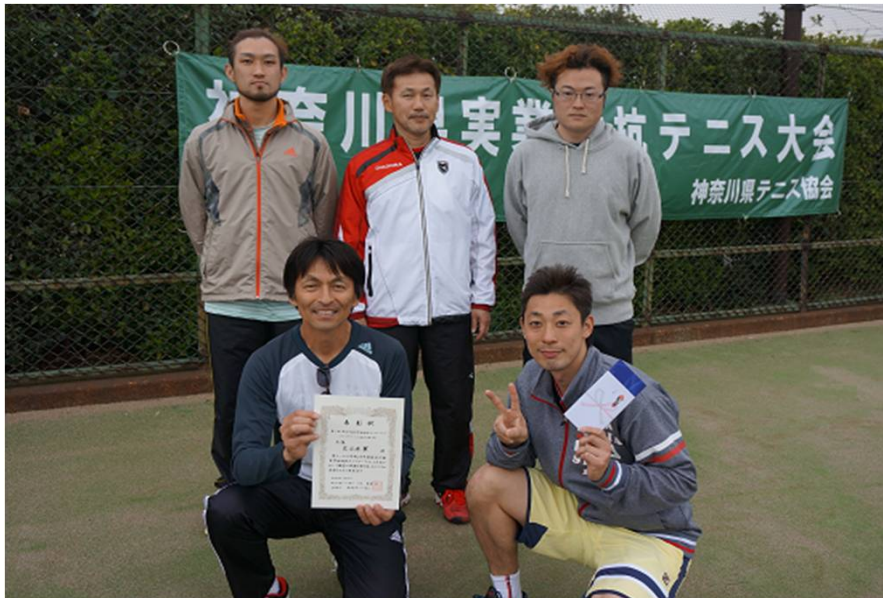
三位 在日米軍 (横須賀市)