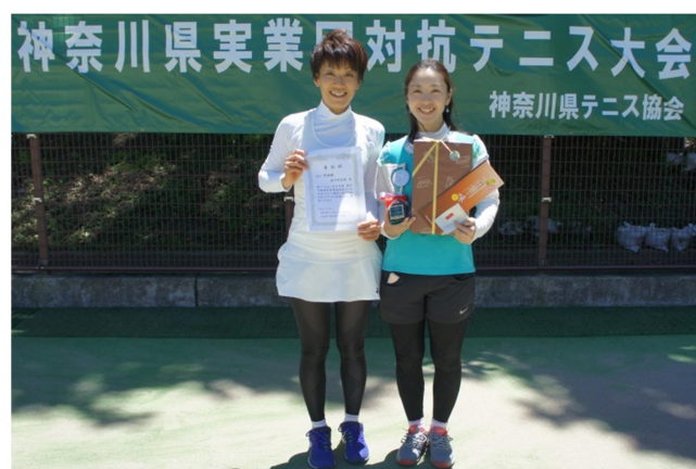
女子準優勝:寒川町役場(寒川町)