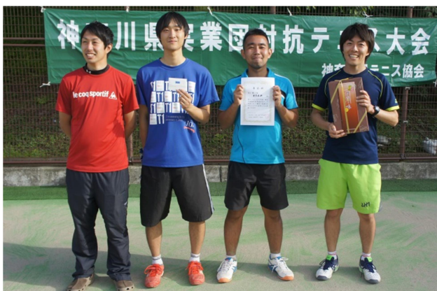
男子3位:東芝京浜(横浜市)