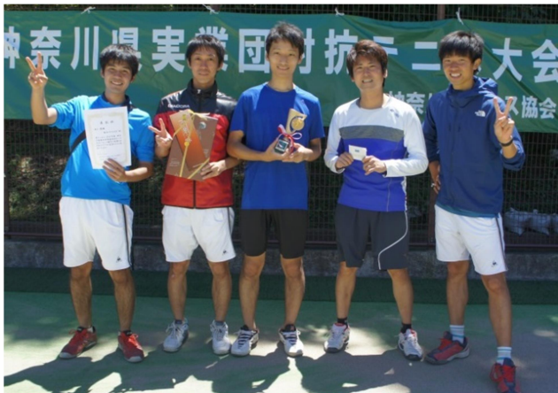
男子優勝:富士フィルム B(小田原市)