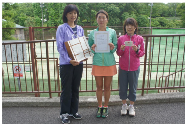
女子3位:東芝小向(川崎市)