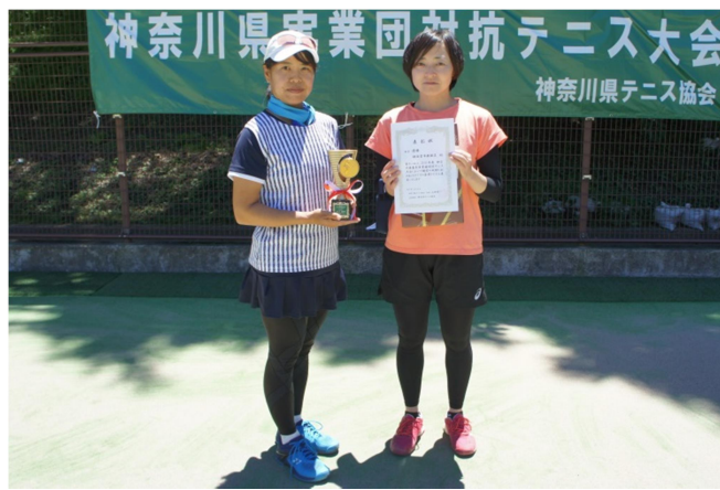
女子優勝:横須賀市教職員(横須賀市)