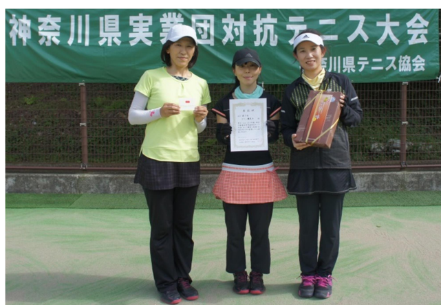
女子3位:ソニー厚木 A(厚木市)