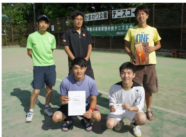
男子3位:横須賀市役所(横須賀市)