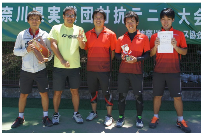
男子準優勝:コマツ(平塚市)